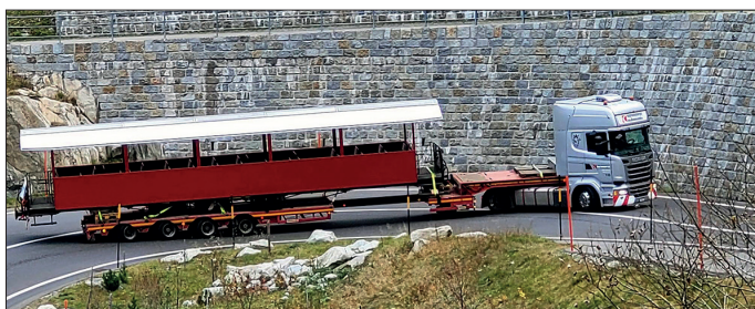
Transport routier de la voiture panoramique OpenAir C 4326