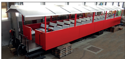
La voiture panoramique OpenAir C 4326

En outre, la voiture panoramique OpenAir C 4326 (ancienne BVZ B 2226) a été transférée à Realp en septembre 2024. Elle faisait partie du train historique du BVZ Zermatt-Bahn, fondé en 2001, et elle a été reprise en 2022 par le DFB. Munie d'un toit de protection, elle circulera principalement dans le train diesel comme attraction appréciée. ■