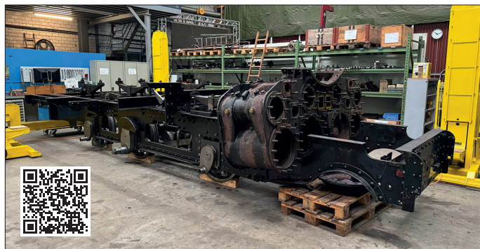
Démontage HG 3/4 no. 1 à Uzwil (26.10.24)

Entre 1992 et 2023, elle a tracté sans faille les trains de voyageurs sur la ligne sommitale de la Furka. En vue de sa révision intégrale, la locomotive no. 1 a été transportée le 29 septembre