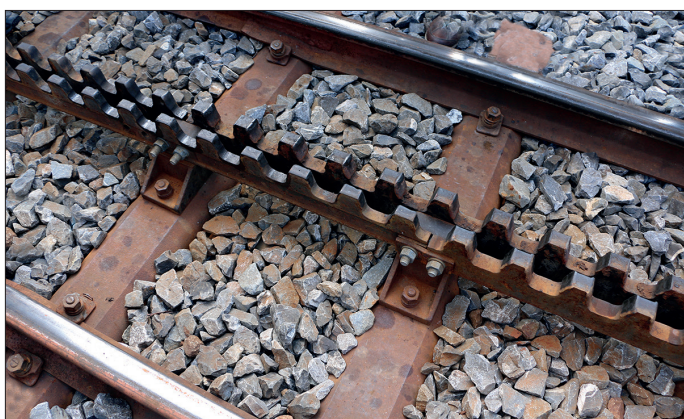
En amont de Gletsch, la crémaillère plus que centenaire est remplacée (à gauche sur la photo).