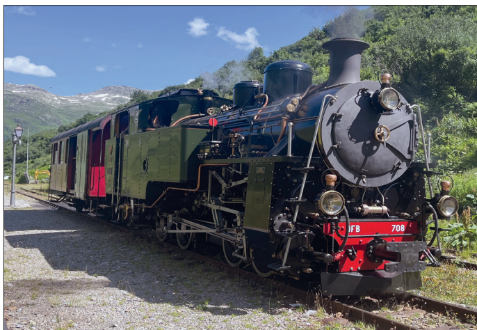
HG 4/4 no. 708 pendant une course d'essai (23. 07. 2024)

La locomotive vietnamienne HG 4/4 no. 708, complètement reconstruite, a été transportée à Realp le 29 septembre 2023. Après les travaux de finition, elle a effectué plusieurs courses d'essai en tractant différentes charges. Le contrôle et la validation de la chaudière ont eu lieu le 3 juillet 2024. Les travaux de remise en service se déroulent conformément à la planification. Dès lors, l'autorisation de circuler devrait être délivrée à temps pour l'inauguration prévue au mois de juin 2025. À mi-mars 2025, des adaptations ont encore été apportées à l'entraînement de la crémaillère. ■