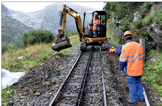
Le renouvellement de la voie entre Gletsch et Muttbach sera poursuivi en 2025 (illustration du 10 sept. 2019).

Vos dons nous permettent de maintenir en état la voie, les ponts et les tunnels. Ainsi, la sécurité des voyageurs peut être garantie. Nous vous en remercions très chaleureusement. ■