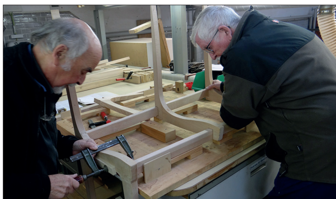
Construction de l'aménagement intérieur de la voiture AB 4463