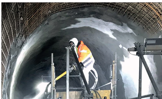
Sécurisation du tunnel de façade de la Furka au moyen de béton projeté