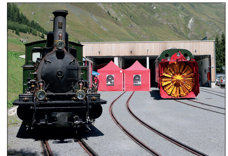
La nouvelle remise pour voitures à voyageurs de Realp