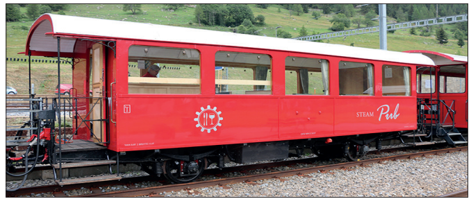
Voiture-buffet «Steam Pub»