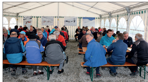
Tente à la Station Furka