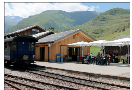
Bistro de la gare DFB à Realp

Vous préparez un voyage pour votre groupe, votre entreprise ou votre société, pour un mariage ou un anniversaire ? Nous sommes votre partenaire idéal.