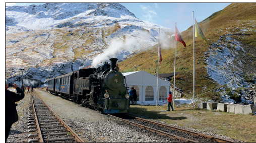
Courte pause à la Station Furka

Prix: supplément valable pour toutes les variantes d'apéro CHF 10.00 par personne