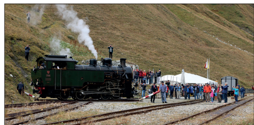
Locomotive sur la plaque tournante