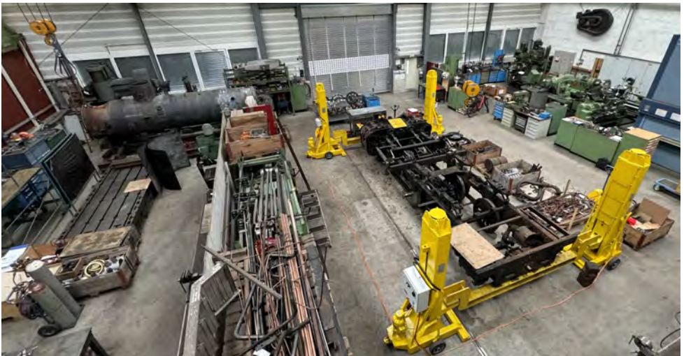
Blick in die Dampflokkwerkstätte Uzwil

« Die Fronarbeiter in der Dampflokkwerkstätte liefern hochstehende Qualitätsarbeit ab. »