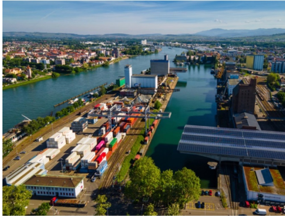
Rheinbasel Hafenbecken 2