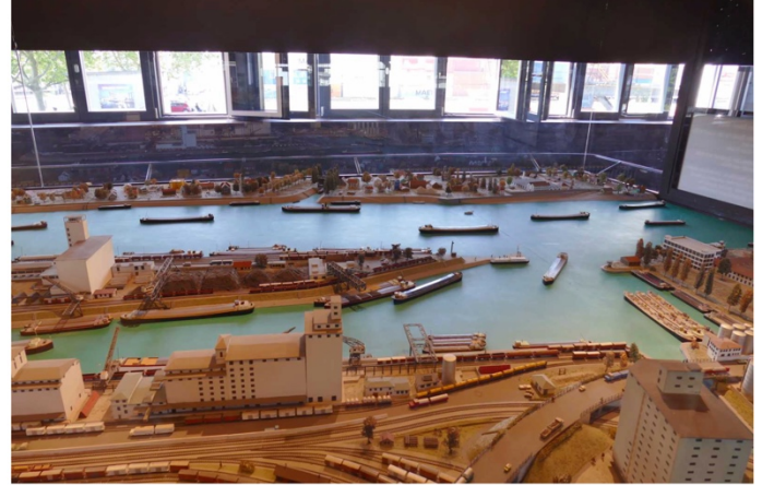
Hafenmuseum Modell Hafenbecken 2

Treffpunkt: 09.45 Uhr Hafenumuseum, Westquaistrasse 2, Basel (Tramlinie 8, Station Kleinhüningen, Fussmarsch Richtung Rhein, ca. 300 Meter)