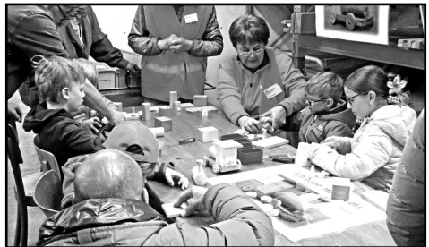
Kinder bauen „ihre“ Dampfloki

Realp nach Aarau zu holen. Nach dem Entfernen der Verkleidung zeigte sich zu unserer Erleichterung, dass der Zustand des Wagenkastens nach 22 Jahren Fahrbetrieb besser als befürchtet ist. Die Revision des Fahrwerks inklusive Gleitlagerschaden erfolgt in Realp.