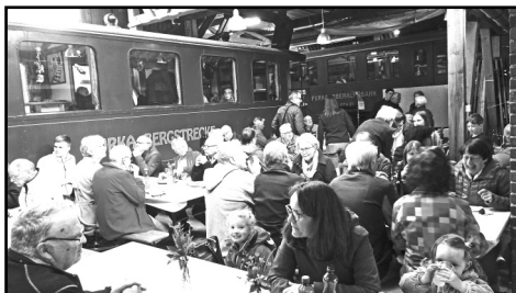
Eisenbahngespräche auf der Piazza und im Häxekafi

Dank für diese Aktion. In unserer Festwirtschaft konnten wir viele kurzweilige Gespräche über die Bahn führen, während eine Miniaturbahn mit Kindern um die Werkstatt dampfte.