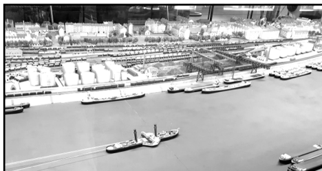
Ein grosses Modell des Rheinhafens gibt einen Überblick über die weitläufigen Anlagen