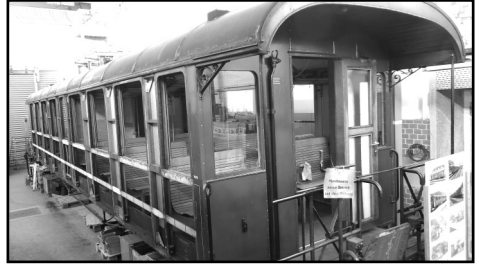
B 4229 mit geöffneter Setenwand

Durch die Ablieferung des Aussichtswagens C 4326 Ende 2024 nach Realp hatten wir in der Werkstatt Platz geschaffen, um den Personenwagen B 4229 für eine Zwischenrevision von