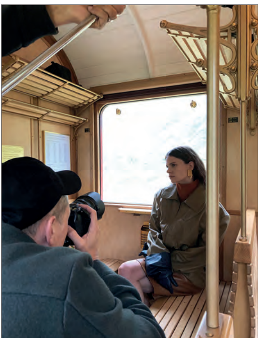
Unsere Dampfbahndiene am 28. August 2025 als Kulisse für eine Fotoreportage, die in einer in Paris herausgegebenen Modezeitschrift veröffentlicht wurde.