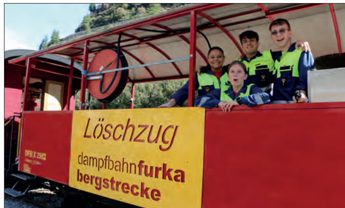
Am 28. September 2025 stand eine Gruppe der Jugendfeuerwehr von Schutz und Rettung der Stadt Zürich im Einsatz.

Um Brände durch Funkenwurf zu verhindern, werden bergwärtsfahrende Dampfzüge im Schutzwald bei Oberwald jeweils von einem Löschzug mit Diesellokomotive begleitet. ■