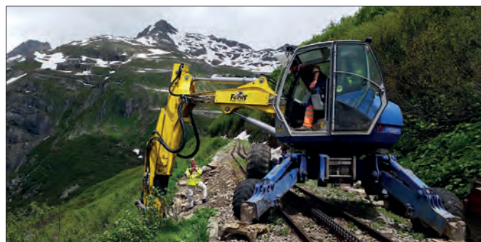
Gleisbauarbeiten oberhalb Gletsch