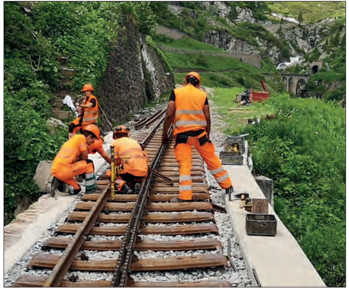
Auszubildende beim Gleisbau in der Rottenschlucht (2024)

Seit der Bauzeit ist der 1874 m lange Furka-Scheiteltunnel ein Sorgenkind. Er geniesst bei den längerfristig geplanten Sanierungsarbeiten erste Priorität. Die Sicherungsmassnahmen im Gewölbe und an den Wänden werden etappenweise realisiert. Es sollen zudem Scanning-Aufnahmen erstellt werden, um den Gesamtzustand der Tunnelröhre detailliert zu erfassen. ■