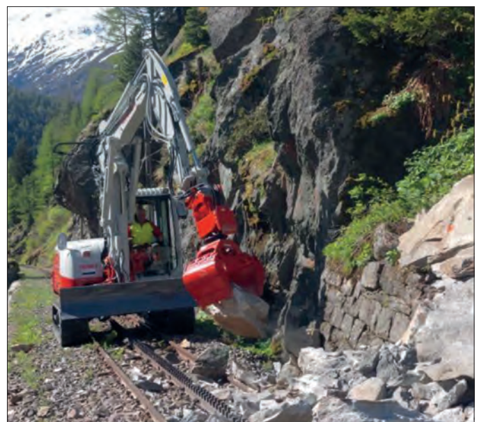
Unser neuer Bagger beim Räumen eines Felssturzes in der Rottenschlucht