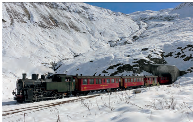
Zauberhafte Winterlandschaft bei der Station Furka

Am 28. September 2025 fiel am Furkapass überraschend viel Schnee. Es war der letzte Betriebstag, und unser Personal musste zum Spaten greifen. Die Dampfloks kamen mit den Schneehöhen von 25 bis 40 cm gut zurecht. ■