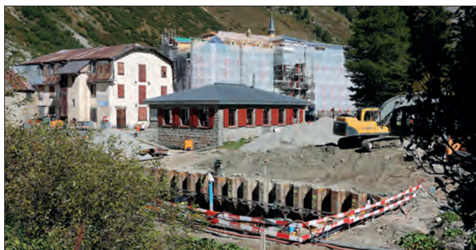
Bildmitte: Altes und bereits restauriertes Postgebäude mit InfoPoint und Toiletten. Im Vordergrund: Aushub für die dreistufige, unterirdisch angelegte Kläranlage (18.09.2025).

Die Sanierung des Hotels Glacier du Rhône macht Fortschritte. Inzwischen hat das Gebäude u.a. ein vollständig erneuertes Dach sowie neue Fenster erhalten. Die Eröffnung ist für 2027 geplant. ■