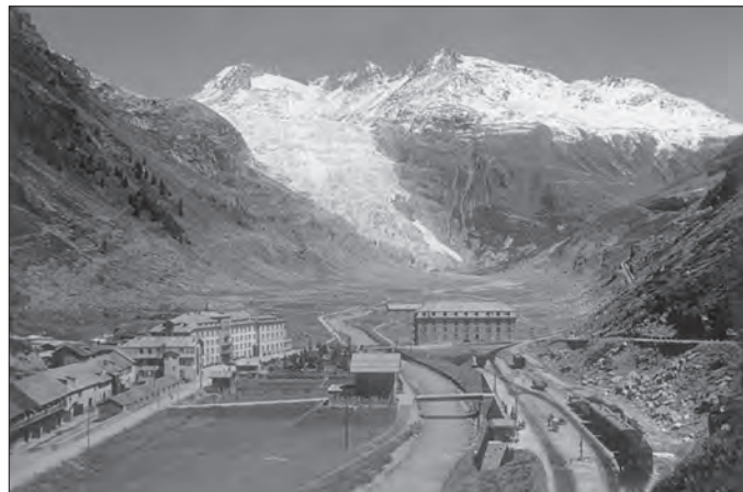
Hotelsiedlung Gletsch mit Rhonegletscher, Galenstock und Furkahörner (um 1928)

Nach langem Dornröschenschlaf ist es 1925 gelungen, den unvollendeten Streckenabschnitt Gletsch–Andermatt–Disentis fertig zu stellen. So konnte die Furka-Bergstrecke ab Juli 1926 von der Furka-Oberalp-Bahn (FO) während den Sommermonaten fahrplanmässig befahren werden.