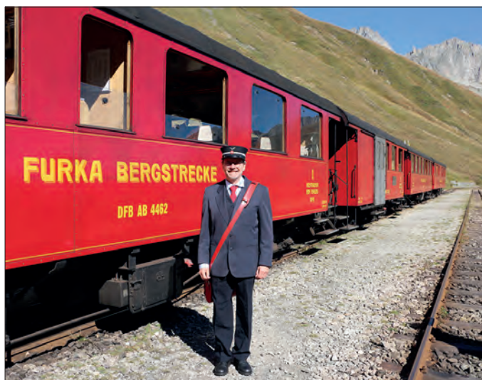
Ein Schauspieler präsentiert sich in einer klassischen Bahnuniform des Zugpersonals.