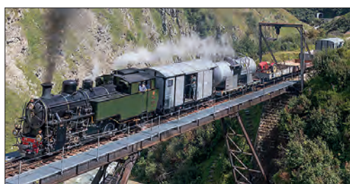
Güterzug bei einer Fotofahrt auf der Steffenbach-Klappbrücke (18.08.2025)

Dank der Unterstützung unserer Spenderinnen und Spender konnten wir im Mai 2025 einen eigenen Raupenbagger kaufen. Mit ihm können unsere Baufachleute verschiedenste Arbeiten wie Räumung, Aushub, Mulchen, Vegetationspflege usw. schneller und besser ausführen. Die Neubeschaffung ermöglicht eine willkommene Arbeitserleichterung. ■