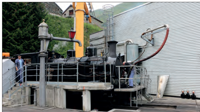
Am Ende eines Arbeitstages werden die Dampflok in Realp gereinigt. Dabei wird auch die Schlacke und der Kohlenstaub entfernt. Im Kesselbereich kommt dazu ein grosser Staubsauger zum Einsatz.