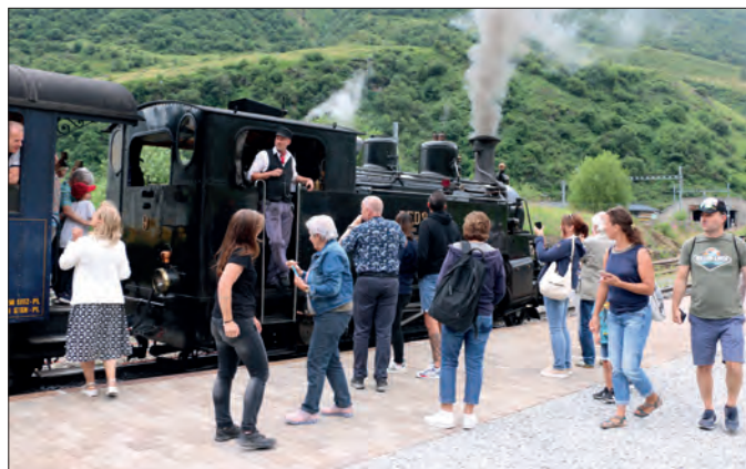
Dank den Gruppenreisen gab es höhere Frequenzen.