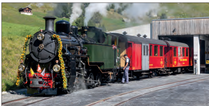
Vor dem Start zur Einweihungsfahrt in Realp