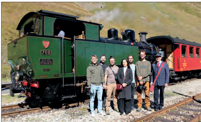
Das Filmteam während dem Aufenthalt in der Station Furka

Am 17. und 18. September weilte ein Schweizer Filmteam bei der Furka-Dampfbahn. Bei bestem Wetter entstanden attraktive Aufnahmen, die auch für die Werbung eingesetzt werden sollen. ■