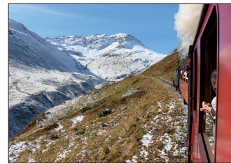
Letzter Betriebstag am 29. September 2024