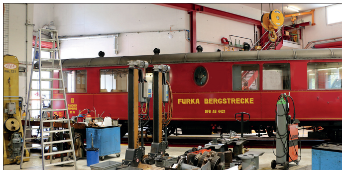
Wagenreparatur in der Depotwerkstätte in Realp