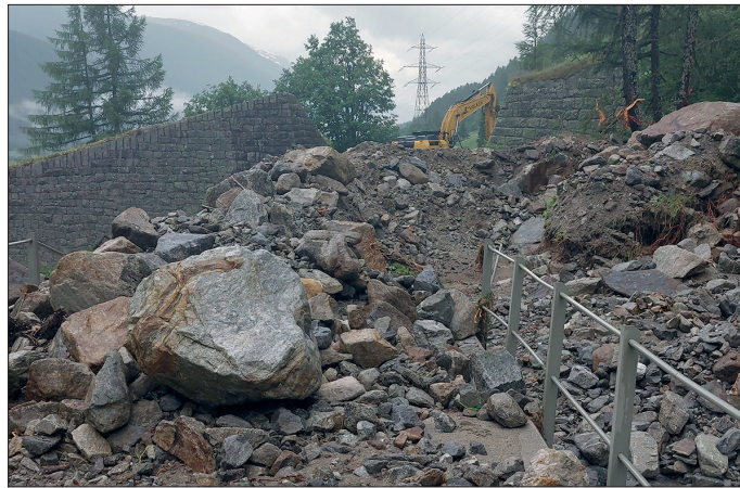
Unwetterschäden oberhalb Oberwald (1. Juli 2024)

Unsere anspruchsvolle Betriebsaison 2024 begann im Juni mit Unwetterschäden. Oberhalb von Oberwald hatte der Hochwasser führende Rätischbach unser Streckengleis verschüttet. Glücklicherweise waren zwischen 30. Juni und 3. Juli genügend Fronarbeitskräfte und Maschinen unseres Bauendienstes verfügbar. So konnte die Räumung und Reparatur umgehend in Angriff genommen werden. Damit ging durch die Streckensperre nur ein einziger Betriebstag verloren. ■