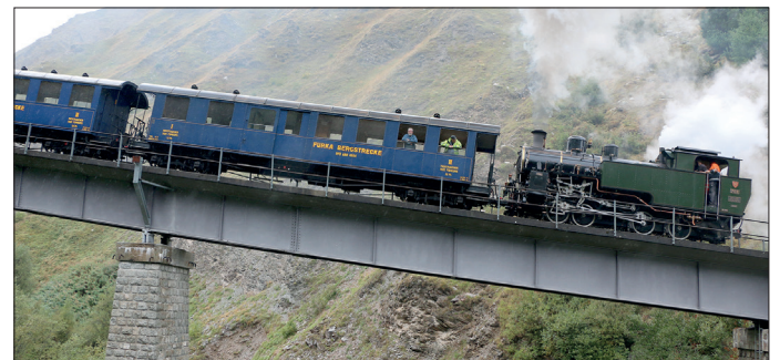
Bremsprobefahrten am 9. Sept. 2024

Die Ende September 2023 in Realp eingetroffene Vierkuppler-Dampflokomotive Nr. 708 ist inzwischen einsatzbereit. Nach den Bremsproben im September fanden im Herbst erste Versuchsfahrten statt. Noch vor Ende 2024 erwarten wir die definitive Betriebsbewilligung des Bundesamtes für Verkehr (BAV). Damit könnte die ehemalige Vietnam-Lok ab Saisonöffnung 2025 fahrplanmässig eingesetzt werden. ■