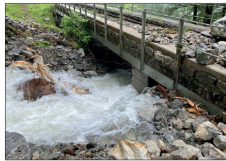
Hochwasser am Rätischbach