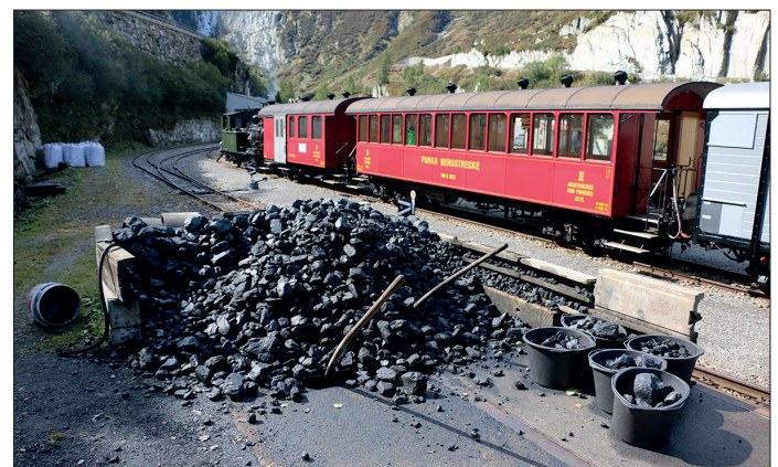
Es ist wichtig, immer genug Kohle zu haben.