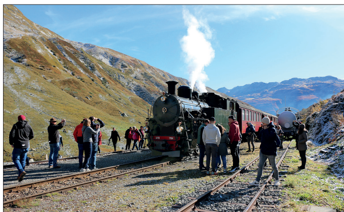
Tiefenbach: Viele Reisende interessieren sich für die Dampflok.