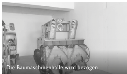
Die Baumaschinenhalle wird bezogen