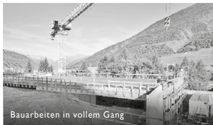
Bauarbeiten in vollem Gang

Dieses Jahr hing der Saisonstart an einem seidenen Faden resp. an der Verfügbarkeit von Beton. Nachdem am Donnerstag vor Betriebsbeginn eine unter dem Lawinenschnee versteckte, abgerutschte Stützmauer entdeckt worden war, begann für die Bauabteilung ein Wettlauf gegen die Zeit. Noch am gleichen Tag wurden die Reparaturplanung gemacht und die Schadstelle geschalt. Dank Entgegenkommen des Kies- und Betonwerks