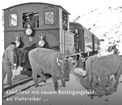
Lokführer mit neuem Betätigungsfeld als Viehtreiber ...

Am 6. September überraschte Petrus die DFB auf der Urner Seite mit einem stärker als erwartet ausgefallenen Wintereinbruch. Auf der Furka gab es gut 30 cm Neuschnee, was die Räumequipe ordentlich ins Schwitzen brachte. Insbesondere das Zelt musste dringend von der immer schwerer werdenden Last befreit werden, da die Zeltblache zu reissen drohte. Der Bahnbetrieb lief ohne grössere Störungen, abgesehen von den üblichen Schwierigkeiten mit Kühen auf dem Bahntrassee. Das Zugspersonal bemühte sich nach Kräften, den Weg für den eigenen Zug freizumachen, worauf die Tiere selbstverständlich bis zum nächsten Zug wieder auf das in diesen rutschigen Verhältnissen offenbar beliebte Gleis zurückkehrten.