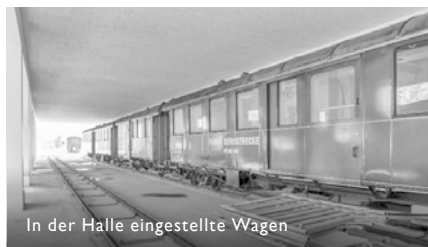
In der Halle eingestellte Wagen