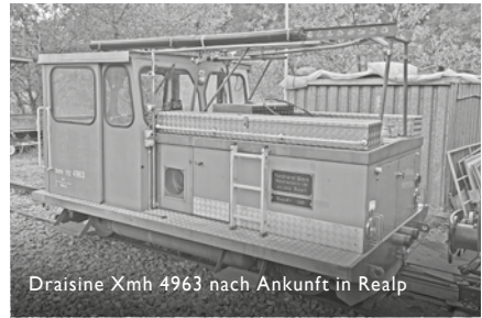
Draisine Xmh 4963 nach Ankunft in Realp

Die DFB konnte von der Matterhorn Gotthard Bahn zwei Draisinen Xmh 1/2 übernehmen. Die Xmh 4963 wird nach der Überholung ab Saison 2020 permanent in Oberwald stationiert und von dort aus als Interventions- und Unterhaltsfahrzeug eingesetzt. Die zweite Draisine der gleichen Bauart wird als Ersatzteilspender «ausgeschlachtet», um von allen relevanten