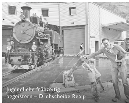
Jugendliche frühzeitig begeistern – Drehscheibe Realp