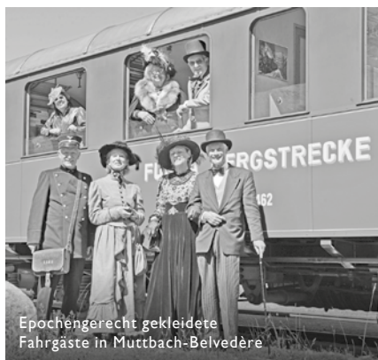
Epochengerecht gekleidete Fahrgäste in Muttbach-Belvedere

Die zahlreichen Unregelmässigkeiten bei Infrastruktur (Lawinnenniedergang ins Depotareal, «verlorene Stützmauer»), Rollmaterial ( Defekt Lok 704, Ausfall HGm 51), Personal (zahlreiche Ausfälle aus gesundheitlichen Gründen, Kündigungswelle Festangestellte) oder durch externe Einwirkungen (Wintereinbruch, Böschungsbrände, Sprayerschäden) konnten mit vereinten Kräften und durch Sondereinsätze der übrigen Mitarbeiter so bewältigt werden, dass die Fahrgäste wenig davon spürten.