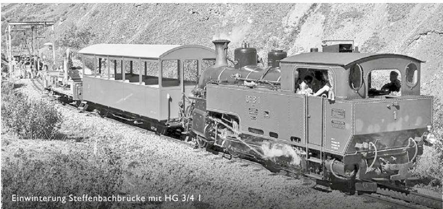
Einwinterung Steffenbachbrücke mit HG 3/4 I

Die finanzielle Gesundung schreitet somit planmässig voran.