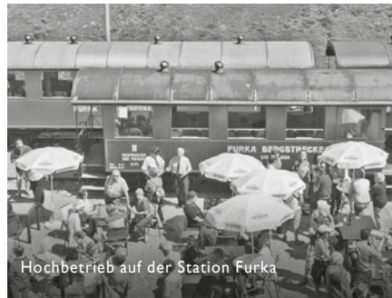
Hochbetrieb auf der Station Furka

Die Online Reservationsmöglichkeit von Café / Gipfeli, Vorbestellungsmöglichkeit von Apéros auf der Furka, und ein rege genutztes Gastroangebot für Gruppen in der Kantine Realp und auf der Furka haben der Gastronomie ein gutes Jahr mit höheren Umsätzen beschert.