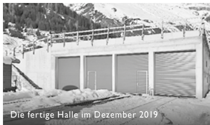
Die fertige Halle im Dezember 2019