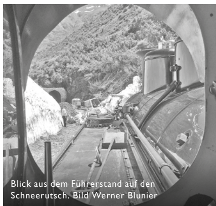
Blick aus dem Führerstand auf den Schneerutsch.

Am Sonntag 29. Juni kam der Gegenzug bei Tunnel II vor einem massiven Schneerutsch zum Stehen, ohne jede Chance den Schnee mit eigenen Mitteln beiseiteschaffen zu können. Die dahinter folgenden Züge wurden vorsichtshalber in Gletsch zurückgehalten und die Diesellok für eine allfälliges Abschleppen des gestrandeten Zuges in Bereitschaft versetzt. Dank Einsatz des zufällig am Sonntagnachmittag anwesenden Stephan Stauber konnte die Strecke mit dem Bagger geräumt und alle Züge mit unterschiedlicher Verspätung nach Realp zurückgeführt werden.