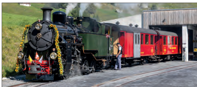
Avant le départ de la course inaugurale à Realp