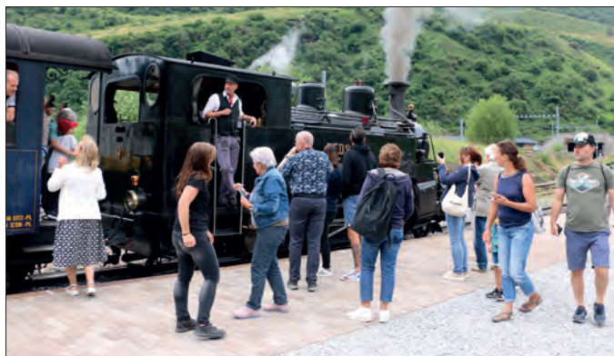
Grâce aux groupes, les fréquences ont augmenté.