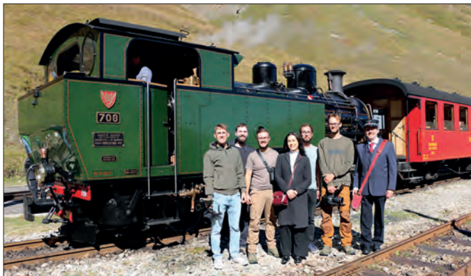
L'équipe de tournage lors de l'arrêt à la Station Furka

Les 17 et 18 septembre, une équipe suisse de cinéastes a séjourné auprès du Train à vapeur de la ligne sommitale de la Furka. Par un temps superbe, de magnifiques prises de vue ont été réalisées. Elles pourront également servir à la publicité. ■