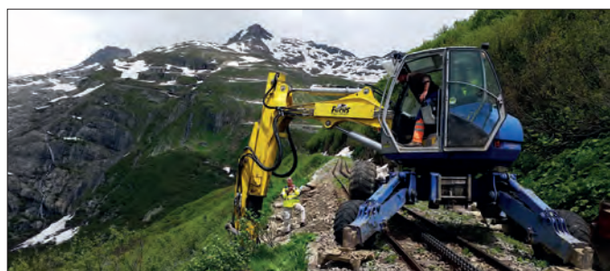
Travaux de réfection intégrale de la voie en amont de Gletsch

Infos « Nous cherchons des collaboratrices et collaborateurs »