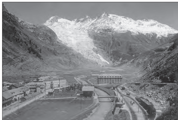
Complexe hôtelier de Gletsch avec le Glacier du Rhône, le Galenstock et les Furkahörner (vers 1928)

En 1925, après de longues périodes d'inactivité, la construction du tronçon Gletsch–Andermatt–Disentis a enfin pu être terminée. C'est ainsi que dès juillet 1926, la ligne sommitale de la Furka a pu être exploitée par le Furka-Oberalp-Bahn