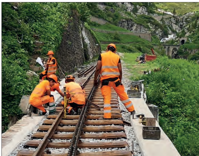
Des apprentis travaillent à la réfection de la voie dans la gorge du Rhône (2024)

Depuis sa construction, le tunnel de faîte, long de 1874 m., donne des soucis. Il a la priorité absolue dans tous les travaux d'assainissement planifiés à long terme. Les travaux nécessaires à la voûte et aux parois du tunnel sont réalisés par étape. Cette année, un scanning destiné à saisir l'état général du tunnel de manière détaillée sera effectué. ■