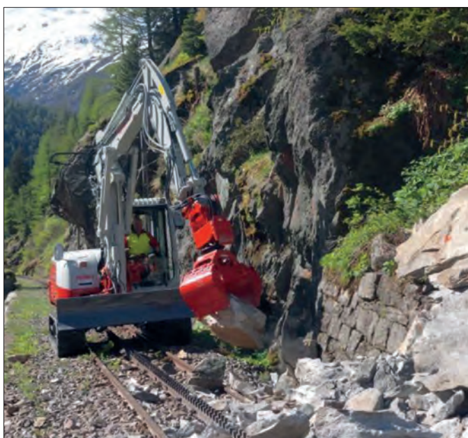
Notre nouvelle pelle mécanique lors du déblaiement d'un rocher dans la gorge du Rhône.