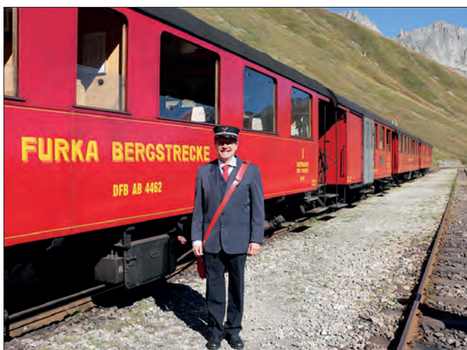
Un acteur a revêtu un uniforme classique du personnel des trains.