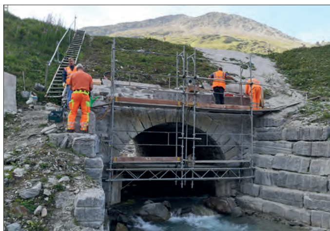
Des bénévoles procèdent à l'assainissement d'un pont (2024)

Chaque année, des moyens financiers considérables sont mobilisés pour assurer la mise en état des installations et du matériel roulant. ■