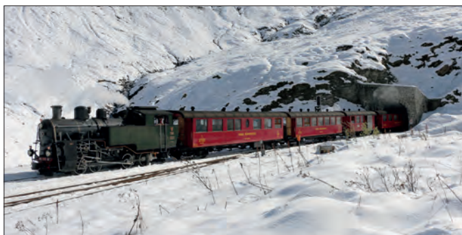
Paysage hivernal enchanteur à la station Furka (28.09.25)

Grande surprise! Le 28 septembre 2025, beaucoup de neige est tombée à la Furka. C'était le dernier jour d'exploitation et notre personnel a dû utiliser les pelles à neige. Les locomotives à vapeur ont affronté avec succès 25 à 40 cm. de neige. ■