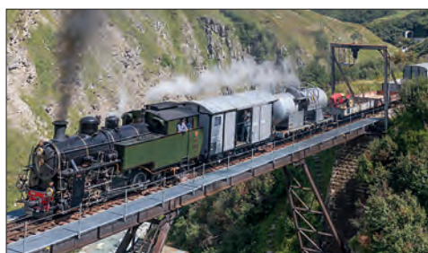
Train marchandises sur le pont amovible du Steffenbach lors d'une course réservée aux photographes (18.08.2025)

En mai 2025, grâce au soutien apporté par nos donatrices et donateurs, une nouvelle pelle mécanique sur chenilles a pu être achetée. Nos spécialistes des travaux peuvent désormais, grâce à elle, effectuer mieux et plus rapidement divers travaux tels que déblaiements, excavations, paillasses, soins de la végétation, etc. La nouvelle acquisition procure un allègement bienvenu du travail. ■