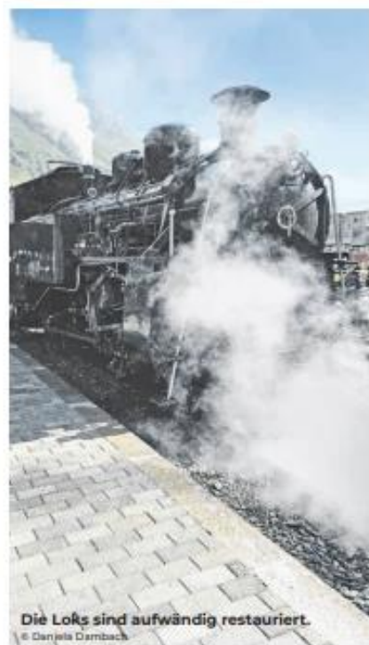
Die Loks sind aufwändig restauriert.