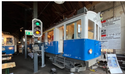
Triebwagen ABe 4/4 7