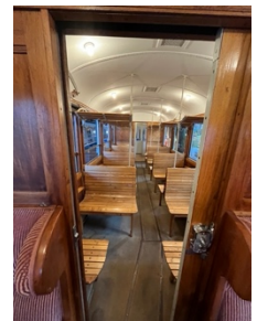
Impressionen Triebwagen ABe 4/4 7