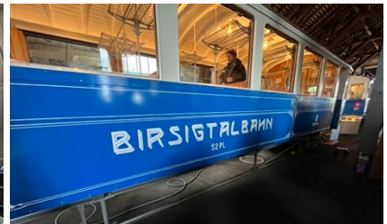
Personenwagen C 52

Die BLT (Baselland Transport AG) stellt dem Verein Pro Birsigthalbahn die Remise als Museum zur Verfügung. Nebst vielen grossen und kleinen Originalen wie Fahrpläne, Billette, antike Bilder etc. sind die Motorwagen ABe 4/4 7 aus dem Jahre 1923 und ABe 4/4 12 aus dem Jahre 1966 sowie der Anhängerwagen C 52 die Glanzstücke der Ausstellung.