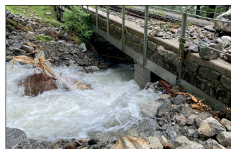
Crues du Rätischbach

n'a touché qu'un seul jour d'exploitation. ■