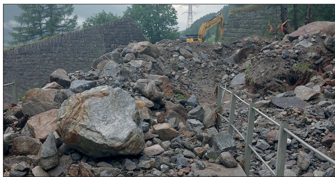
Dégâts dus aux intempéries en amont d'Oberwald (1er juillet)

Notre difficile saison d'exploitation 2024 a débuté en juin avec des dégâts causés par des intempéries. En amont d'Oberwald, les crues du Rätischbach ont enseveli la voie. Par chance, entre le 30 juin et le 3 juillet, beaucoup de collaboratrices et collaborateurs bénévoles et suffisamment de machines de notre division des travaux étaient à disposition. De ce fait, le déblaiement et les réparations nécessaires ont pu être immédiatement entrepris. Ainsi, l'interruption de la voie