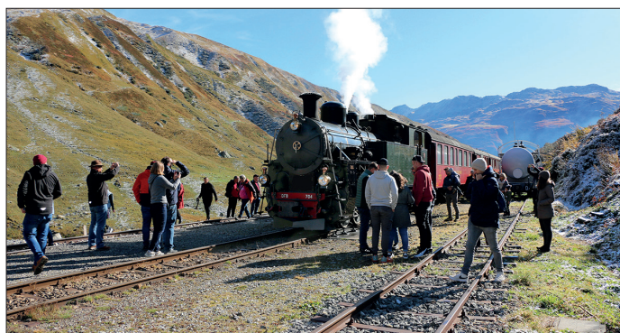
Beaucoup de voyageurs s'intéressent à la locomotive à vapeur.