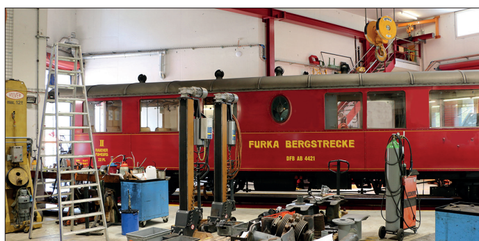
Réparation des voitures aux ateliers de Realp