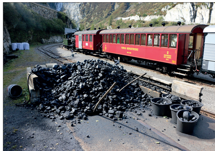
Il est important d'avoir toujours suffisamment de charbon.