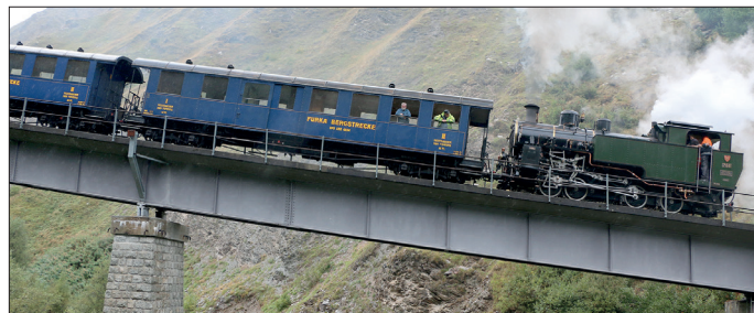
Lors des courses d'essai de frein du 9 septembre 2024

Malheureusement, la saison 2024 ne s'est pas déroulée selon nos attentes. Le mauvais temps a altéré plusieurs jours d'exploitation et a en-