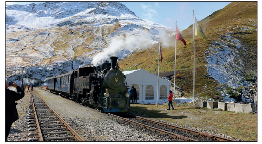
Station Furka: Kurze Ruhepause