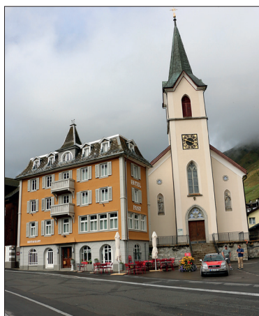
Hotel Post in Realp

Der Brunch wird während der Dieselzug-Fahrt von Realp nach Oberwald serviert.