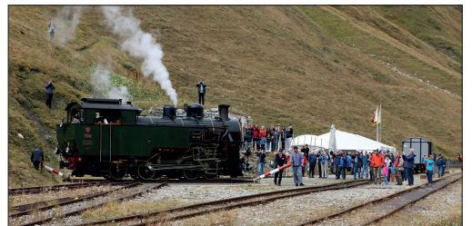
Dampflokomotive auf der Drehscheibe