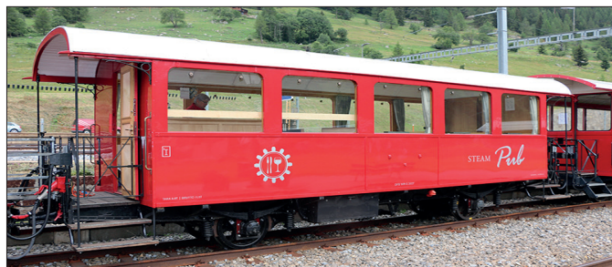
Büffetwagen «Steam Pub»