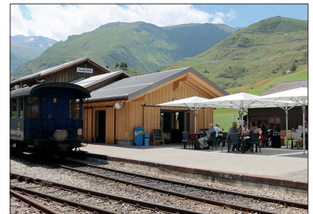
Bistro-Gaststätte in Realp