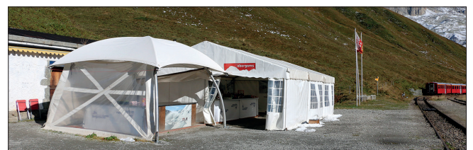
Station Furka: Erfrischung mit Bratwurst