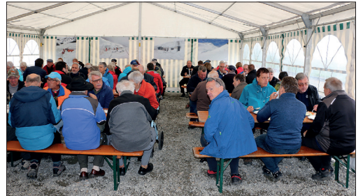
Verpflegungszelt in der Station Furka