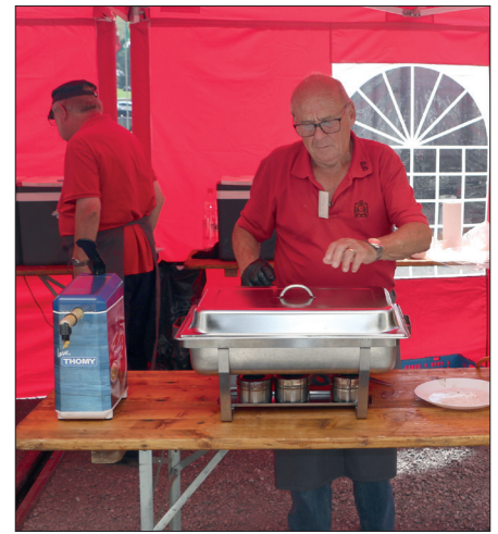
Schmackhaftes aus dem Grillzelt

Abholung am bedienten Getränke-Büffet. Kein Service am Tisch.