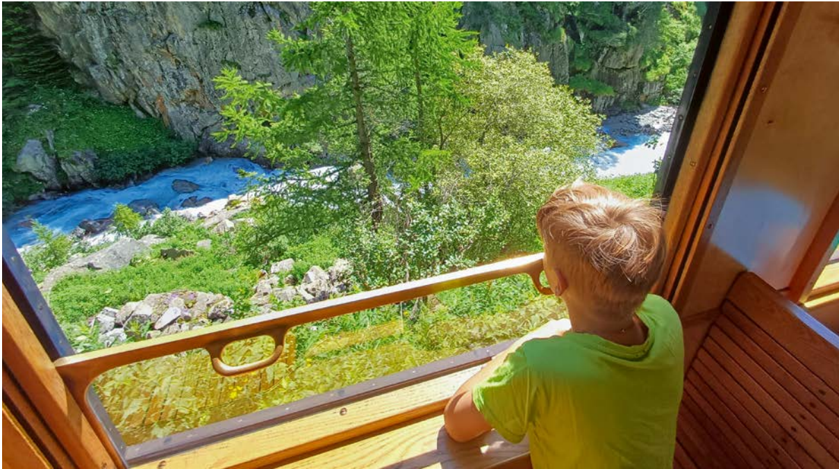
Spektakulärer Ausblick in die Rottenschlucht.