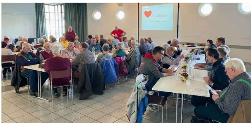
Die Hauptversammlung in Bassersdorf