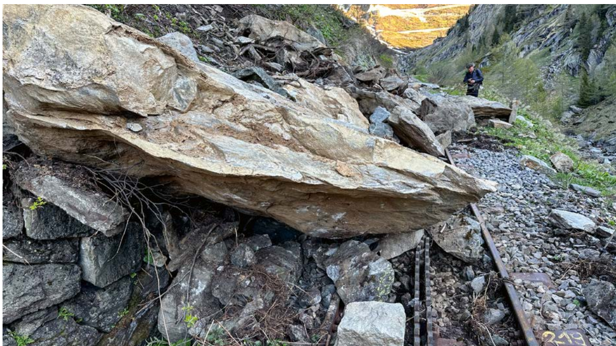
Schäden durch Stein- schlag unterhalb des Kehrtunnels

Stiftung Furka Bergstrecke, Obergesteln VS: IBAN CH90 0076 5000 H086 3207 7, Walliser Kantonalbank