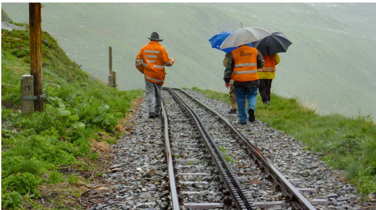
Streckenbegehung: Auf dem Weg in die gemeinsame Zukunft

Wir laden alle herzlich ein, mit uns gemeinsam diesen Weg zu gehen – mit Leidenschaft, Tatkraft und Freude an einer einzigartigen Idee, die Generationen verbindet.