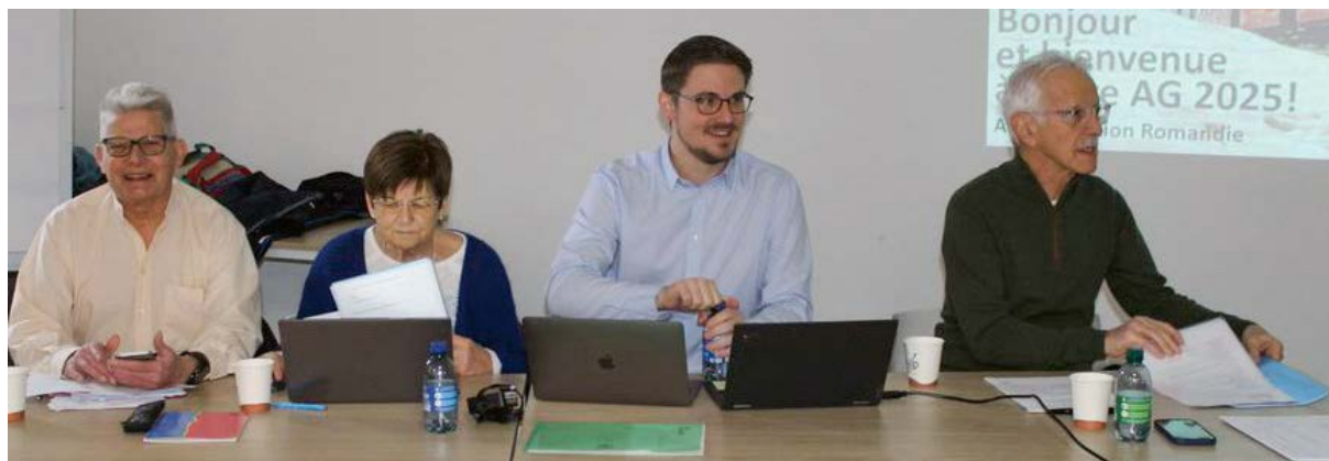
Photos des participants