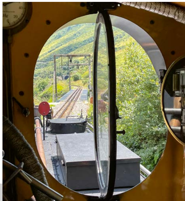
Begegnung von Dampf- und Diesellok in Oberwald