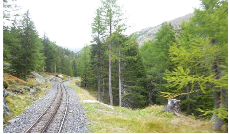
Der Zug fährt über die Lammenbrücke, durch den Lammenwald der Rottenschlucht entlang.