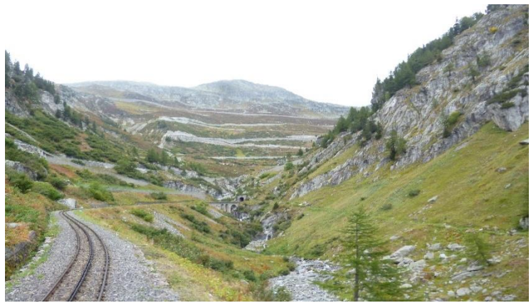
Nach der Durchfahrt des Kehrtunnels erreicht der Dampfzug den Bahnhof Gletsch.