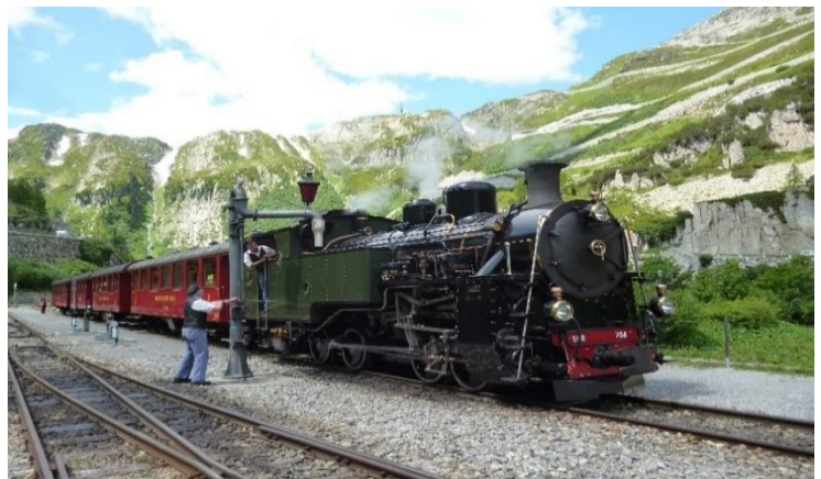
Für die Bergfahrt nach Muttbach erhält die Dampflok frisches Wasser.