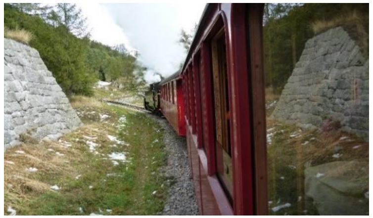
10:50 DFB-Bahnhof Oberwald: Abfahrt des Dampfzuges.