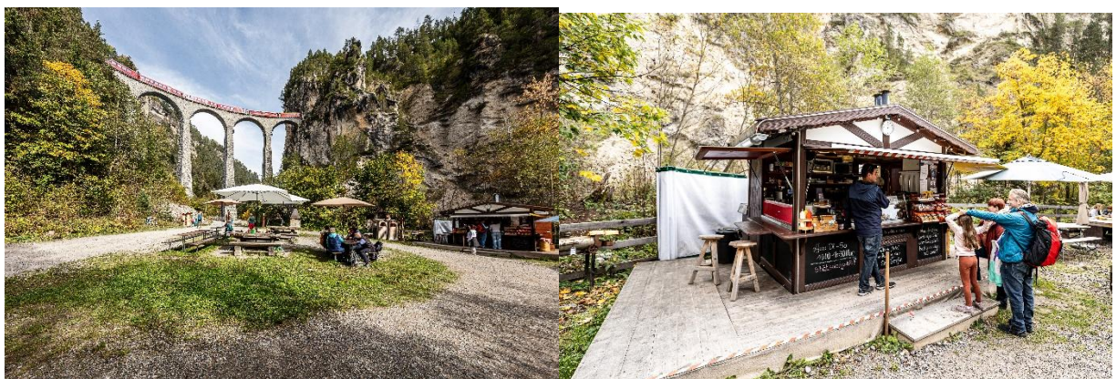
Schmitten GR Viaduktplatz

Direkt beim Viaduktplatz bietet der Infokiosk Filisurer Glace, Snacks, Getränke sowie Souvenirs der Landwasserwelt an. Kinder können sich austoben, während der Blick auf das Wahrzeichen Graubündens – den Landwasserviadukt – einfach atemberaubend ist. Nach einer erholsamen Pause geht es gestärkt weiter zu Fuss zur «Haltestelle Schmitten GR Landwasserviadukt», von wo euch der Viaduktshuttle ganz gemütlich zurück nach Filisur bringt.