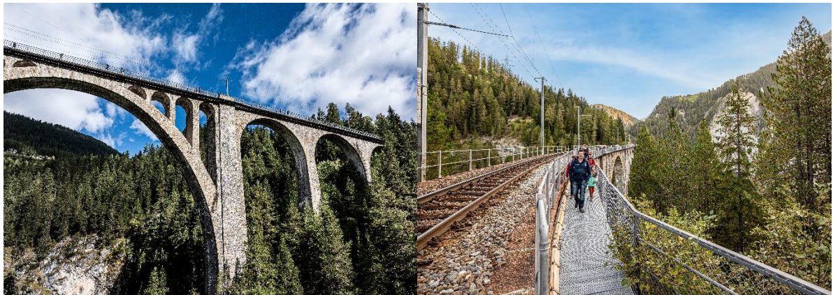
Sky Walk Wiesnerviadukt

Beschreibung: Von Davos Platz fährt der historische Zug bis nach Filisur, du steigst aber bereits eine Haltestelle früher in Davos Wiesen aus. Von hier aus kannst du den höchsten Viadukt der Rhätischen Bahn, den Wiesnerviadukt, zu Fuss überqueren. Der Sky Walk führt als Fussgängersteg parallel zur Schiene und bietet einen spektakulären Ausblick.